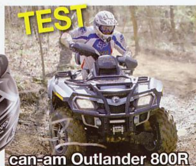
can-am Outlander 800R