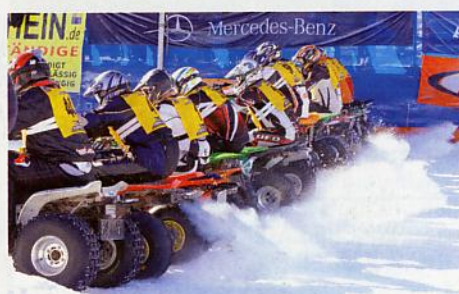
Dieses Jahr reicht der Schnee — Action und Fun sind so für Fahrer und Zuschauer garantiert