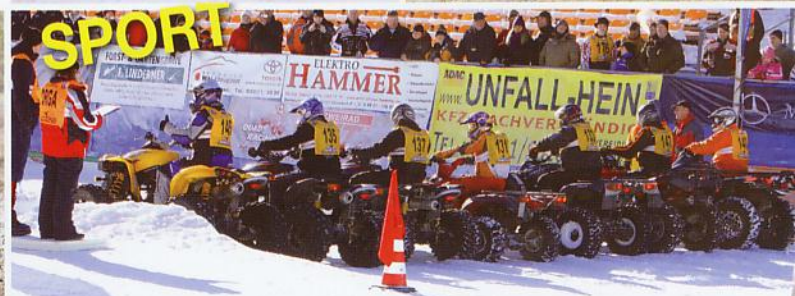
Schnee SpeedWay 2010 + Renntermine 2010