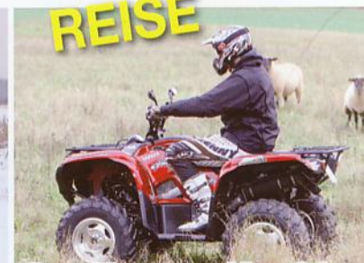
Der Jäger aus Kurpfalz